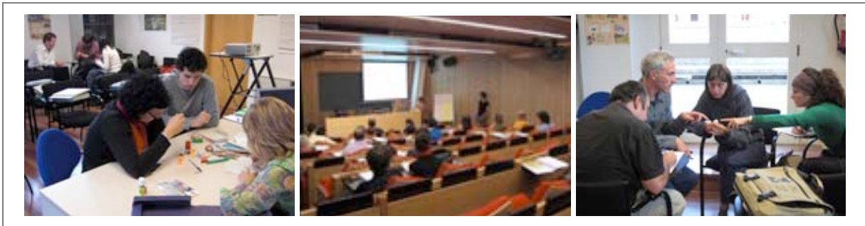
Imatge 4. Accions de formació en CPV.

Des d'una actitud interna de transparència i objectivitat, la vessant pedagògica d'Ecoinstitut s'ha extès a altres consultors públics i privats amb l'objectiu de maximitzar el benefici públic que persegueix l'assoliment de la compra verda. En aquesta línia de treball, l'entitat participa activament en llistes de distribució i grups d'intercanvi d'informació amb la finalitat d'incrementar el coneixement i l'aprofitament dels recursos elaborats per altres administracions, com la llista del Procura+ 23 , del la PNUMA 24 , o del grup d'experts en compra i contractació verda de la Unió Europea 25 .