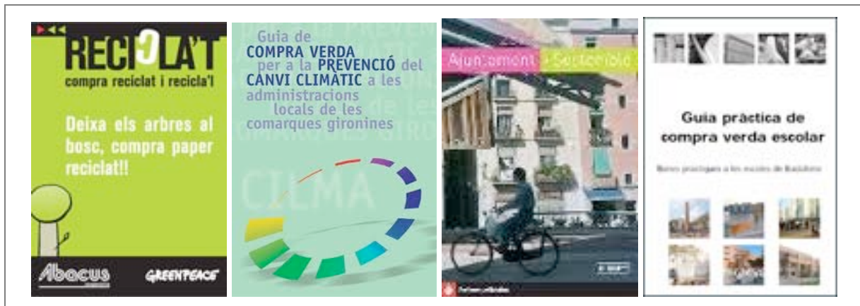
Imatge 1. Projectes de compra verda realitzats per Ecoinstitut a Catalunya 15 .

A continuació es relaciona els principals serveis tècnics en compra verda d'Ecoinstitut a Catalunya (veure el llistat detallat als Annexes):