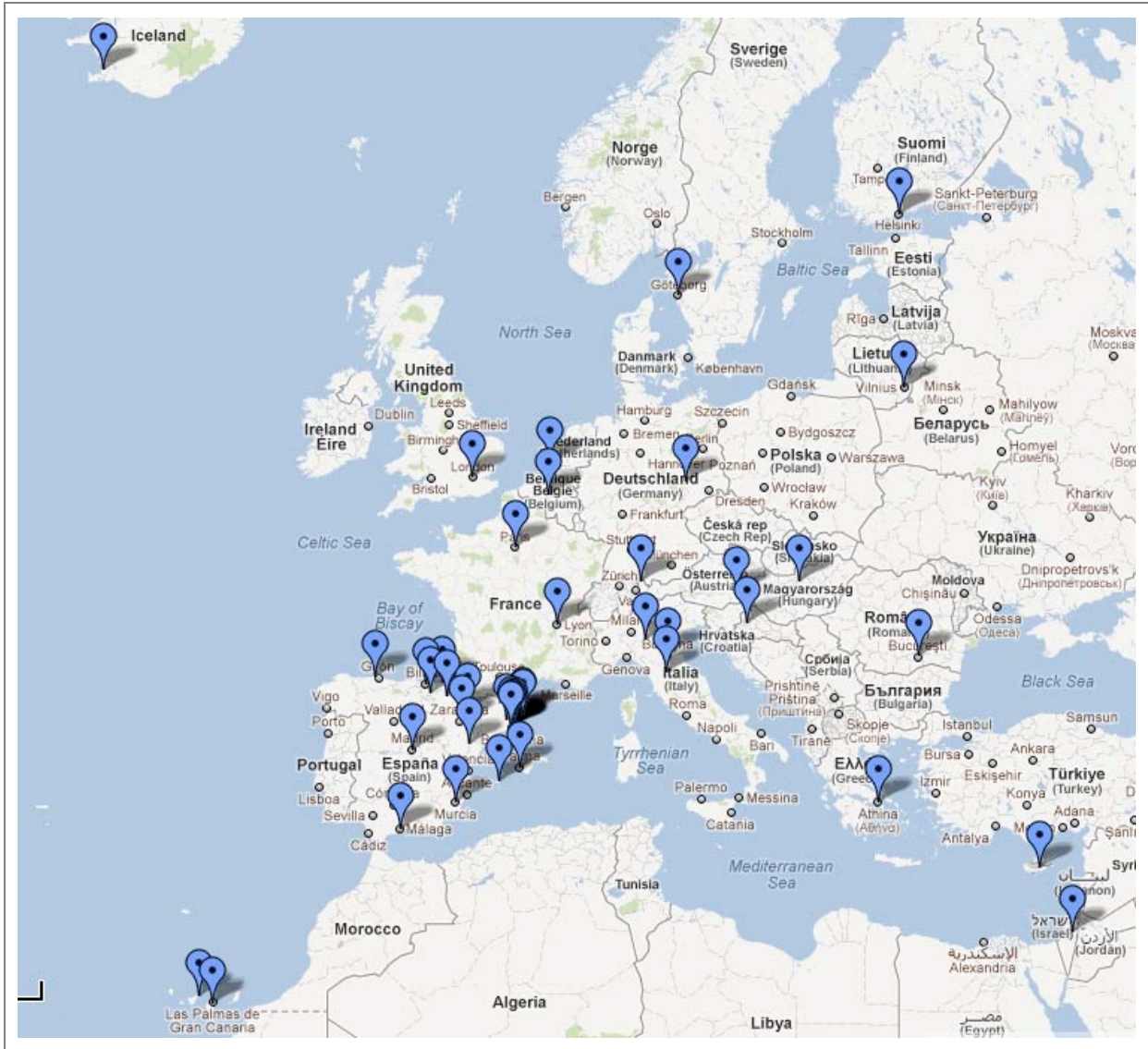
Imatge 3. Presència d'Ecoinstitut en l'àmbit de la CPV a Europa i al Mediterrani.

El següent gràfic visualitza la projecció territorial d'Ecoinstitut en l'àmbit de la compra verda on s'identifiquen 47 ciutats on l'entitat ha desenvolupat alguna o varies iniciatives de compra verda. D'aquestes localitzacions 11 pertanyen a Catalunya, 15 a l'estat espanyol i unes altres 21 a ciutats d'Europa i del Mediterrani.